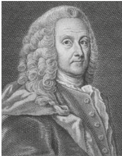
C.F. Clemens: L. Holberg

Dieses Design ist Teil einer kleinen, von den Komödien Ludvig Holbergs inspirierten Kollektion. Der dänisch-norwegische Dichter lebte 1684-1754, aber obwohl das lange her ist, hatte Holberg ein besonderes Talent dafür, verschiedene Menschentypen zu schildern – und auszuliefern – die heute ebenso aktuell sind wie damals.