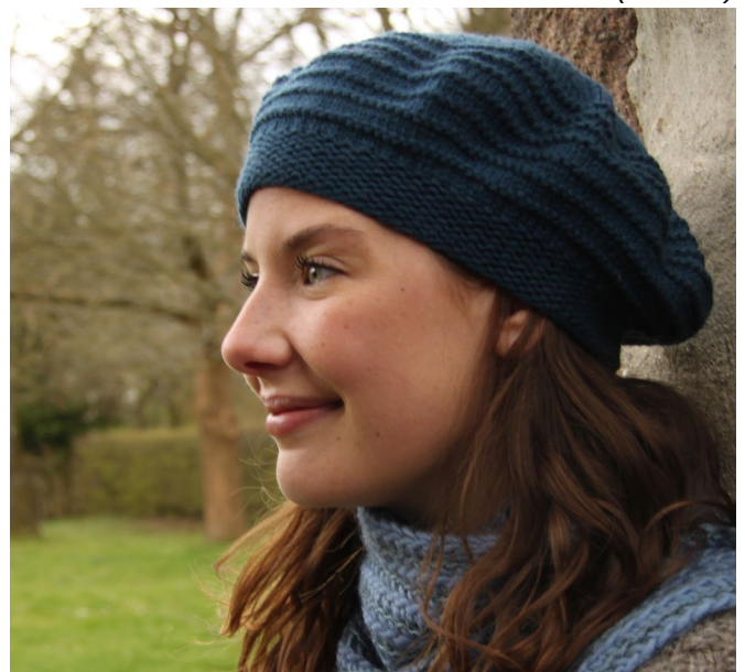
Hue i Peruvian Highland Wool (PHW)