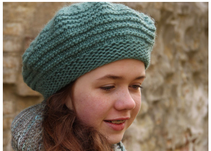
Hue i naturgarn (NG)