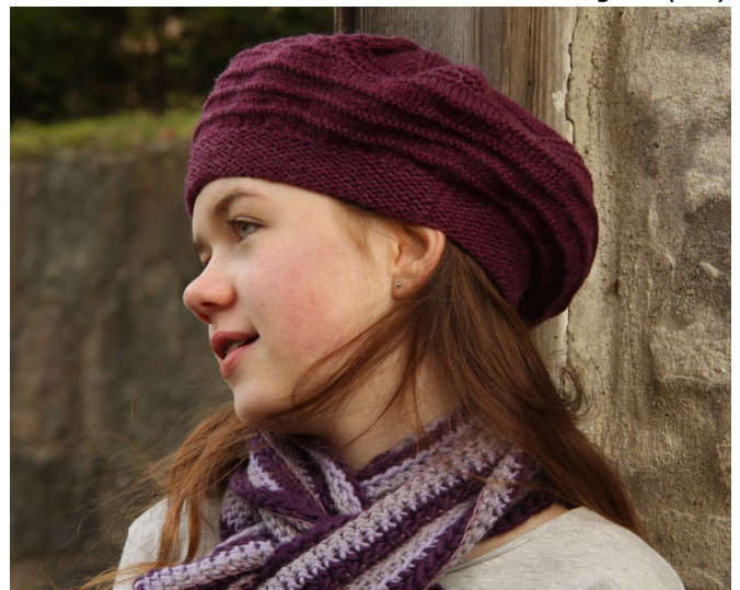
Hue i dobbelt Arwetta Classic (2xAWC)