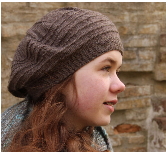
Hue i enkelt Arwetta Classic (1xAWC)